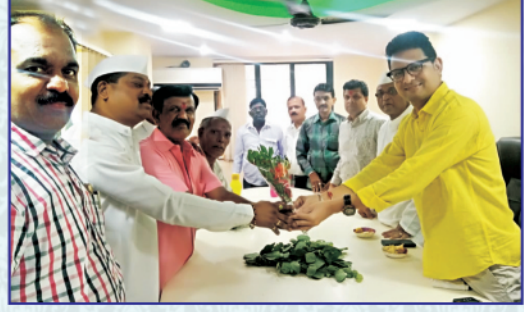
विजयादशमीच्या शुभमुहूर्तावर आयोजित केलेल्या श्री सत्यनारायण महापूजेप्रसंगी आलेल्या मान्यवरांचा अध्यक्षान्च्या हस्ते सत्कार सोबत संस्थेचे संचालक मंडळ