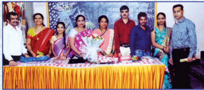
संस्थेचे व्यवस्थापक व सहकारी कर्मचारी वर्ग आणि दैनंदिन ठेव प्रतिनिधी