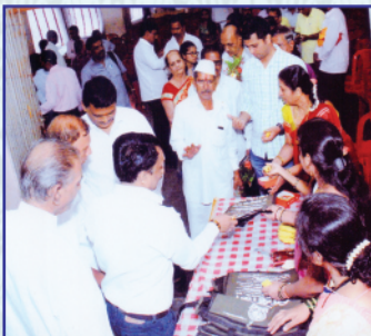
२१ व्या वार्षिक सर्वसाधारण सभेप्रसंगी भेट वस्तू स्वीकारताना सभासद वर्ग.